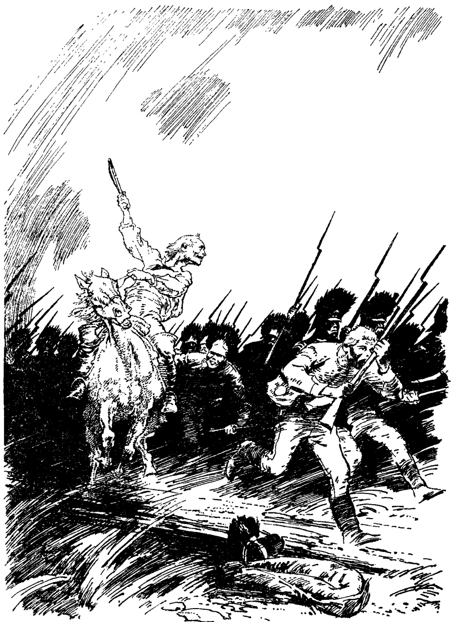
В одной рубашке, с обнаженной головой, с нагайкой в руке, Суворов весь день провел на коне.