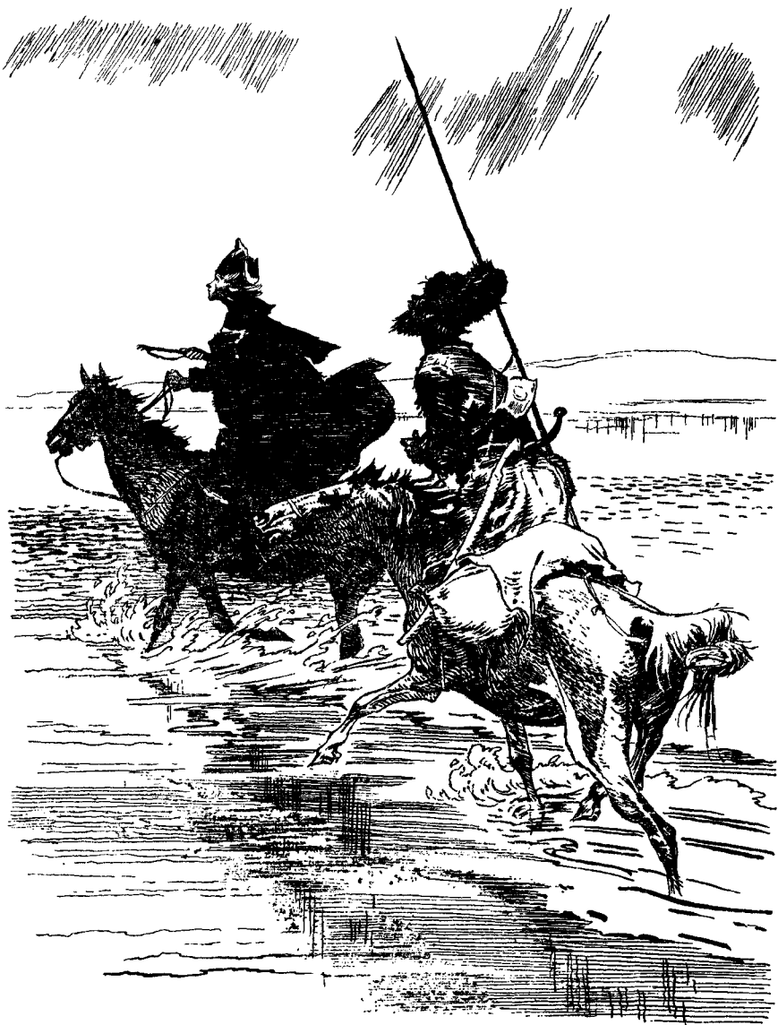
Суворов с одним казачьим урядником пустился напрямик к Дунаю.